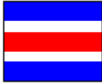
"C" Cambio de recorrido